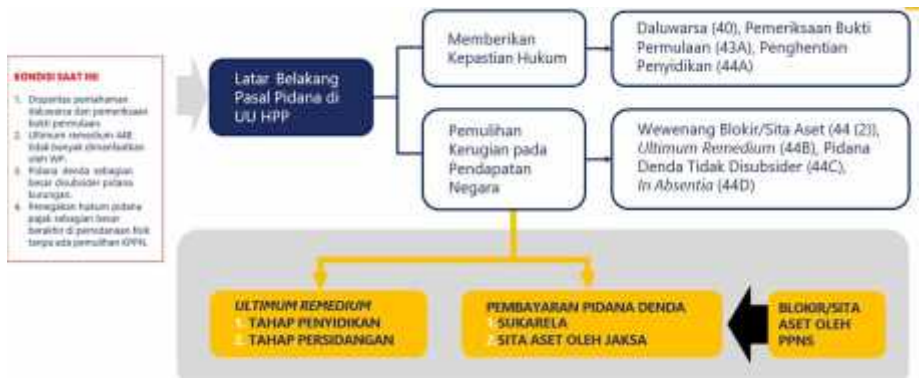
Gambar 1 Penegakan Hukum Pidana Pajak UU HPP

Berikut ini adalah penegakan hukum pidana pajak yang sesuai dengan Undang-Undang Harmonisasi Peraturan Perpajakan (UU HPP):