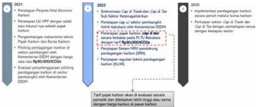
Gambar 3 Rancangan Peta Jalan Pajak Karbon

Berikut ini adalah Peta jalan pajak karbon dirancang untuk transisi energi transisi yang adil dan berkelanjutan: