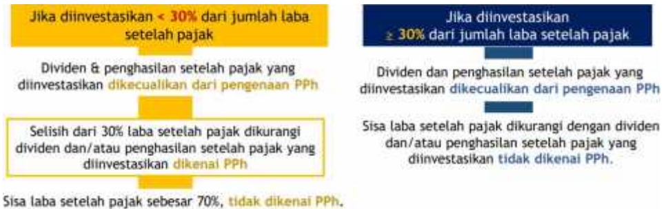
Gambar 2 Skema Pengakuan Pajak