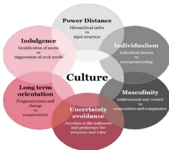
Gambar 1. The Essence of National Culture

dan sangat erat berhubungan dengan perilaku dan cara berkomunikasi. Hofstede mengembangkan model originalnya menggunakan analisis faktor berdasarkan hasil survei terhadap nilai-nilai karyawan perusahaan IBM di seluruh dunia antara tahun 1967 dan 1973. Teori aslinya mengusulkan bahwa nilai-nilai budaya dapat dianalisis dengan empat dimensi yaitu dimensi individualisme-kolektivisme ( individualism-collectivism ); penghindaran ketidakpastian ( uncertainty avoidance ); jarak kekuasaan ( power-distance ) yang berkaitan dengan kekuatan hierarki sosial, dan dimensi maskulinitas-feminitas ( masculinity-femininity ) atau orientasi tugas versus orientasi orang. Penelitian lanjutan Hofstede di Hong Kong mendorong untuk menambahkan dimensi kelima, yaitu orientasi jangka panjang, untuk mencakup aspek nilai yang tidak dibahas dalam paradigma asli atau teori awal. Pada 2010, Hofstede menambahkan dimensi keenam, indulgensi versus menahan diri.